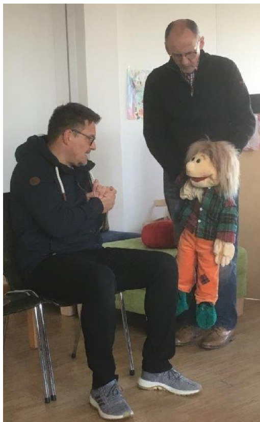
Der „fremde“ Autofahrer versucht, „Heini“ zum Einsteigen zu bewegen.